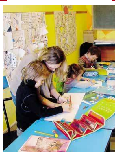
Ogni sabato all'oratorio di Mozzo si tengono gli incontri per i bambini russi che vivono nella Bergamasca. Nelle foto, due momenti delle lezioni con le educatrici del gruppo Nash Mir

spense sui metodi di apprendimento della lingua. Tale evento era stato organizzato dal "Fond Russskij Mir" ente che sponsorizza i progetti culturali russi all'estero analizzando le domande pervenute, tra le quali anche la nostra. Un bilancio contenuto permetterebbe l'introduzione di ulteriori novità, come lo studio dell'in-