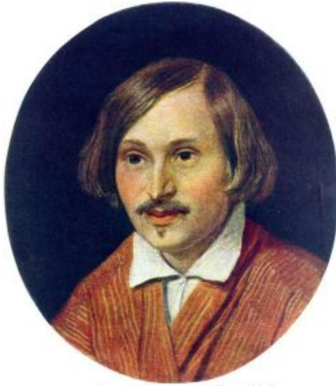
Nikolaj Vasil'evich Gogol' (1809-1852)

Associazione Culturale "ITALIA-RUSSIA" - sezione di Bergamo Associazione Italiana per i Rapporti Culturali e di Amicizia con la Russia