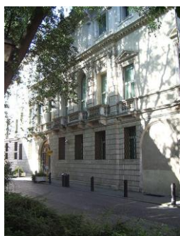
Vicenza: Palazzo Leoni Montanari

Associazione Culturale "ITALIA-RUSSIA" - sezione di Bergamo Associazione Italiana per i Rapporti Culturali e di Amicizia con la Russia