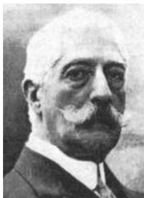
Giovanni Verga (1840-1922)

Gli incontri saranno accompagnati dalla lettura di brani selezionati dalle opere degli autori, nonché dalla proiezione di fotografie e materiale visivo.